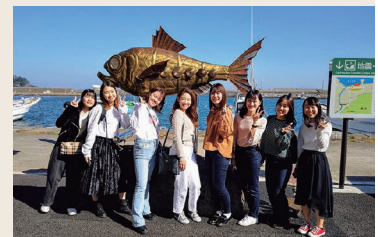
伊豆稲取の名産、金目鯛の彫刻の前で、記念撮影。

について教わる中で、若い人の心を打つ飾り方やストーリーをゼミ生が新たに考えたり。熱川バナナワニ園のレトロでおしゃれなイメージをアピールする提案をしたり。学生の特権としてしがらみや予算に縛られない、自由な発想で取り組んでいます。