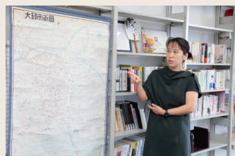
大邱の古地図を持って植民地時代に思いを馳せながら歩く。

取って調査しています。認識することも大事ですが、人とつながることも重要。それをきっかけに別な出会いや発見につながることも多いです。実際に動いた際の化学反応は自分を大きく広げてくれるので、現場に出ていくことをためらわないでほしいです。