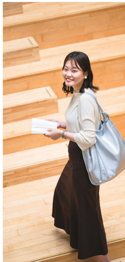
マネジメント学部

ファッションとは、服などの“モノ”だけではなく、エンタメなどの“コト”を含んだ生活文化産業全体の流行を意味するようになりました。ファッションビジネスは、人々が新しい流行を受け入れて、社会現象となることを企図した経済活動です。本授業では、そのようなファッションのメカニズムを理解し、時代を見通す分析力と独創的な発想力について学びます。