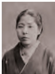
あとみ かけい 跡見 花蹊