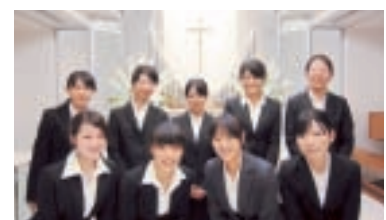
ロイヤルパーク・ホテルにて

ゼミでは、必要に応じてホテルのバックヤード見学や、関係者を招いて講演して頂いたりしています。写真は、ロイヤルパーク・ホテルを見学した時のものです。このほか教室外での学習として、春学期にはゼミ生に首都圏におけるシティー・ホテルについての調査をさせています。