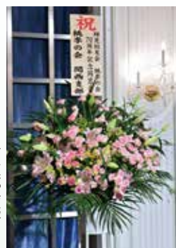
関西支部会様より