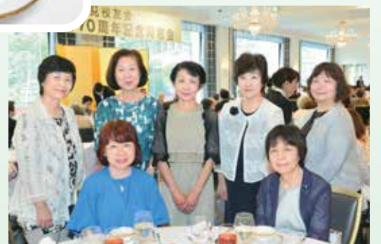
25期 マンドリンクラブ