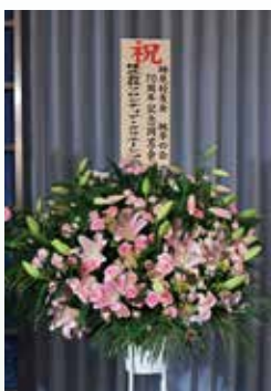
株フロンティアアクリエイション様より