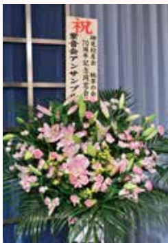
紫音会アンサンブル様より