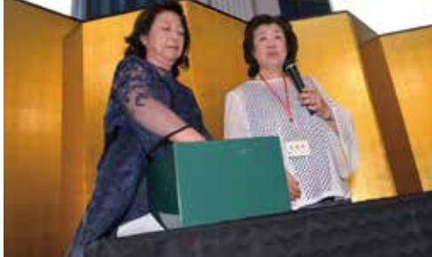
幹事長・副幹事長