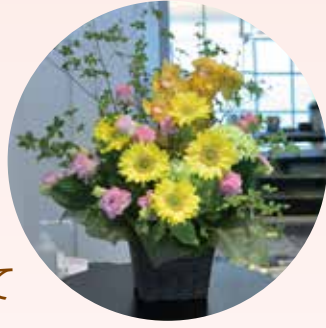
ホテルニューオータニ様より