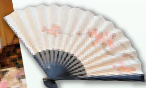
桃李の会特製 記念・桜扇子