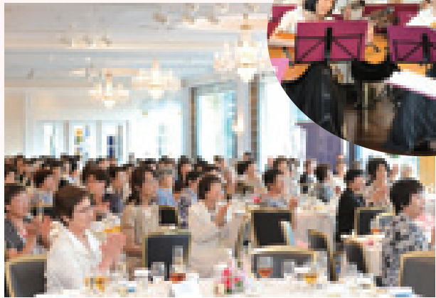
マンドリンクラブ OGの皆様の演奏