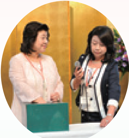
幹事長・副幹事長