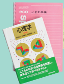
「心理学概論」のテキストとノート

脳のメカニズムや、耳で音を聞いたり目で物を見るという感覚についてなど、日常生活で当たり前を感じていることも心理学の領域のひとつであると「心理学概論」で学び、ここだけを扱うのが心理学ではないと知りました。