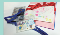
実習先の子どもたちからのプレゼント

「家族療法論」は数多くのカウンセリングを経験されている先生のお話が興味深く、家族それぞれの役割について改めて考えさせられました。カウンセリングにもいろいろなやり方があることを知り、視野が広がったと思います。