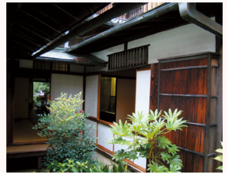
図8. 緒方洪庵が営んだ適塾跡。