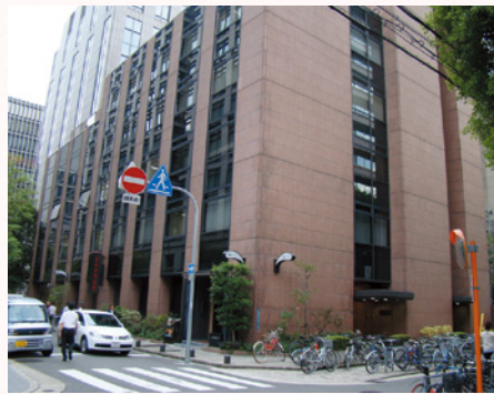
図9. 後藤松陰の広業館塾跡。