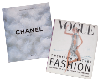
シヤネル(写真上)と雑誌『VOGUE』(写真下)のファッションの変遷を記した写真集

※ココ・シヤネル……「古い価値観にとらわれない女性像」をブランド・ポリシーに、シヤネルを世界有数のファッション・ブランドに押し上げたファッション・デザイナー。