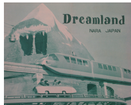
奈良ドリームランド(写真上)と松島ホテル(写真下)のパンフレット

※リゾート法……正式名称は「総合保養地域整備法」。リゾート産業を発展させ、国民が多様なレジャーを楽しむことで、経済効果をあげることを目的に1987年に制定。